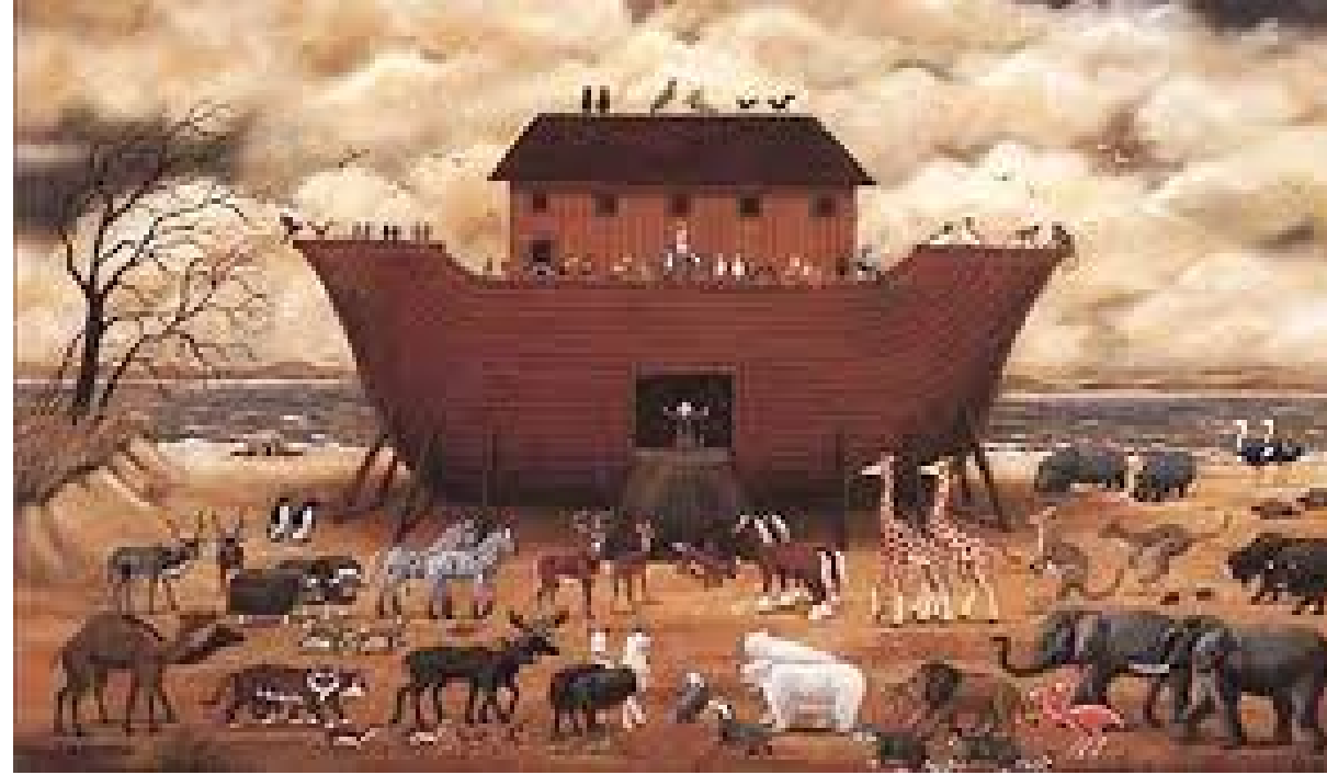
L'arca di Noè