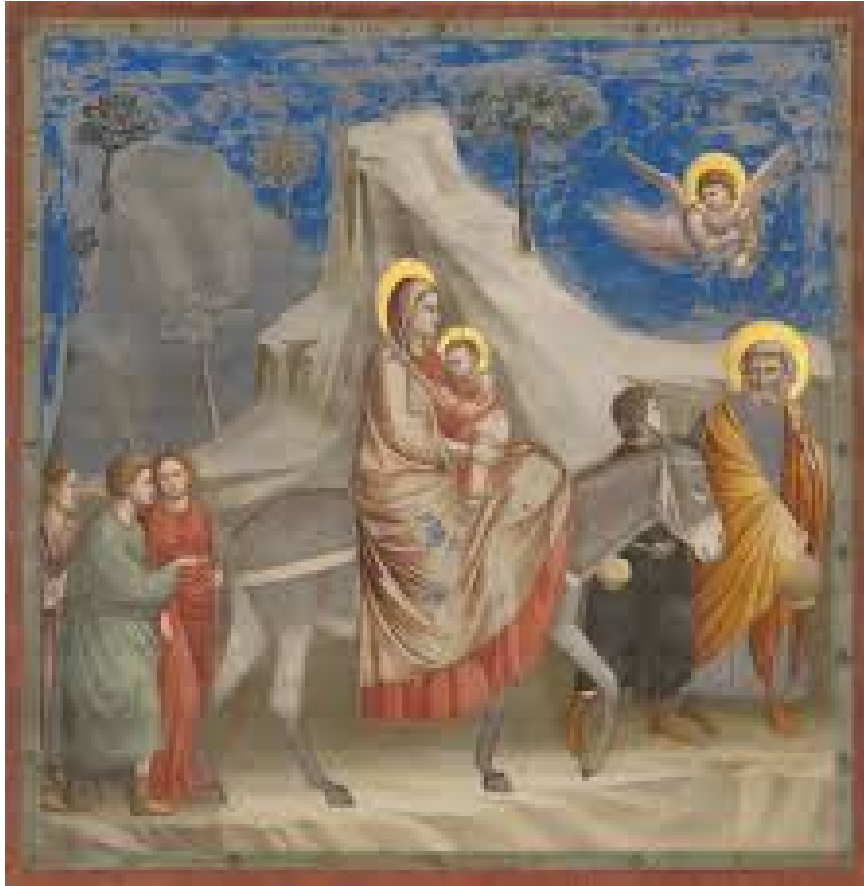
La fuga in Egitto