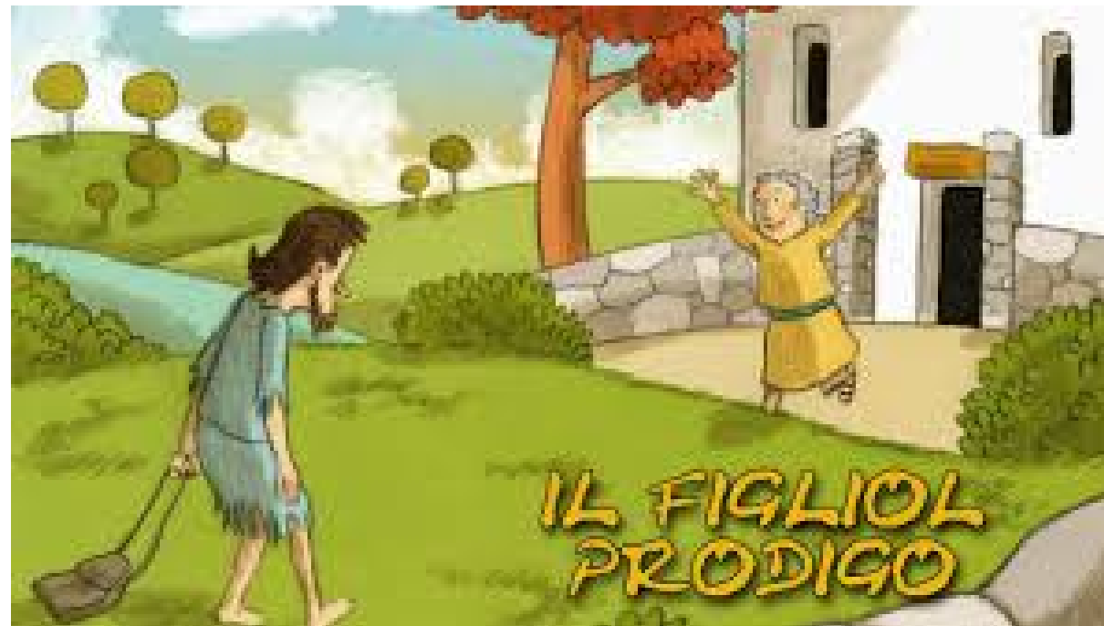
IL FIGLIOL PRODIGO